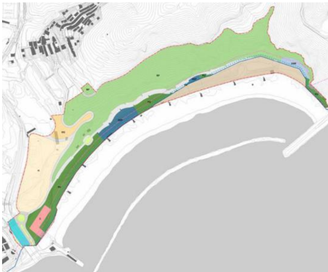
Figura 2. Propuesta de ordenación de la Alternativa 0. Imagen extraída del DIE.

Es la no materialización de la propuesta de ordenación, entendida como “ la no realización del plan propuesto ”. En este caso, este supuesto teórico se ha entendido como la alternativa de mantener la ordenación pormenorizada y determinaciones vigentes en el ámbito de intervención según PGOU-05.