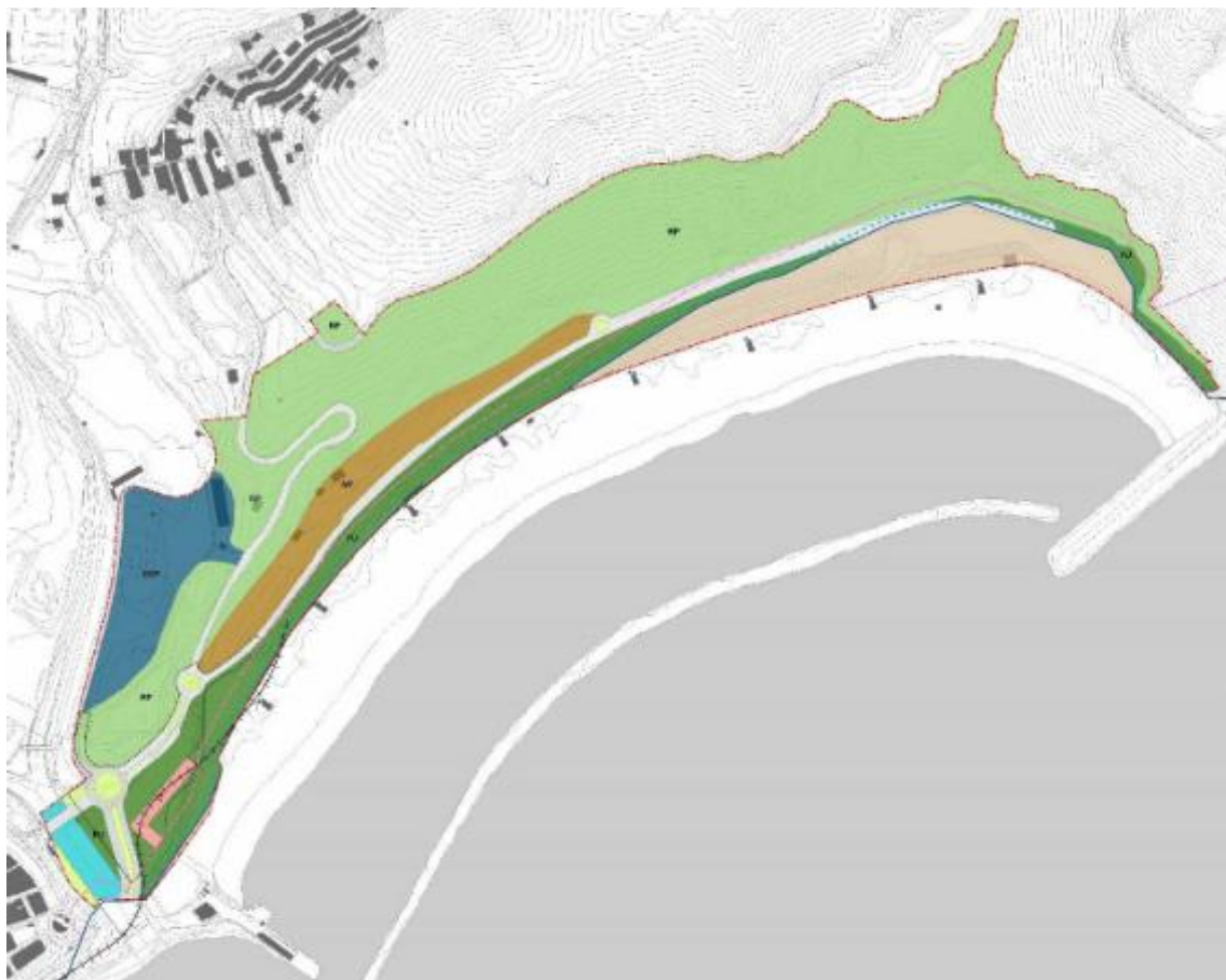
Figura 3. Propuesta de ordenación de la Alternativa 1. Imagen extraída del DIE.

- Con respecto a la desembocadura del Barranco de Las Huertas y de El Cercado, la ordenación se limita a reconocer las obras de encauzamiento realizadas incorporando la prolongación de la Avenida marítima de San Andrés sobre dicho cauce tal y como establece el PGOU-05.”