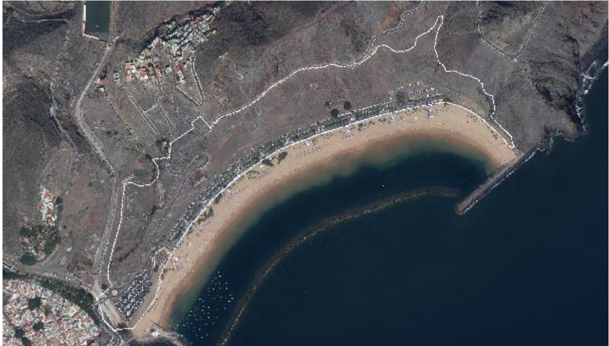
Figura 1. Ámbito de la modificación menor, incluido el ajuste mencionado con respecto a la delimitación del “ Ámbito de actuación municipal A ” según el vigente PGOU-05, sobre ortofoto territorial de GRAFCAN (marzo 2024). Elaboración propia.

incluirlos en la presente modificación para que no queden descolgados de las nuevas determinaciones a incorporar”.