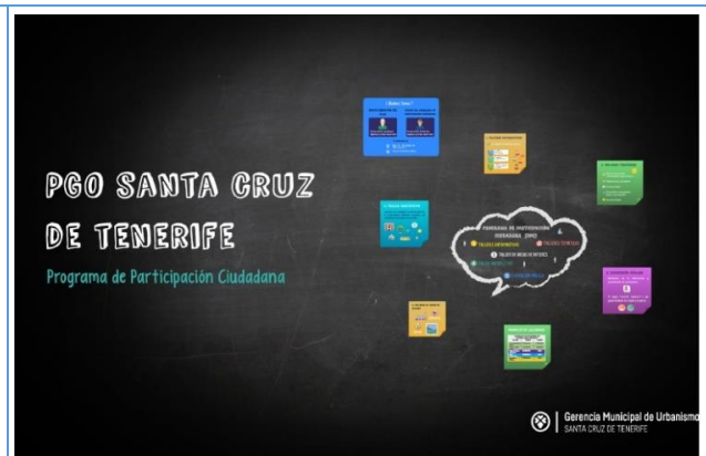
Imagen 3. Prezi explicativo del PPC

Tras esta explicación, del PPC se procede a exponer la actualidad y los objetivos del Plan General de Ordenación de Santa Cruz. Se explican, finalmente “Las reglas del Juego”, es decir, el cometido del Programa de Participación Ciudadana en relación a la posible inclusión de las propuestas que emanen de él, en el PGO, y las limitaciones que este impone. Tras la proyección anterior, se inicia un proceso de ruegos y preguntas, y finalmente se explica la metodología de trabajo que se va a llevar a cabo en la segunda parte del taller.