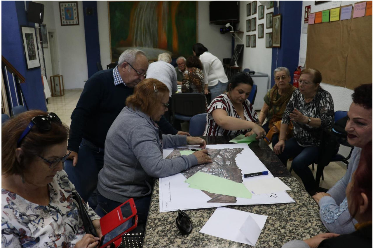
Imagen 5 y 6: trabajo en cada una de las mesas

aspectos que se deben mejorar o que generan mayor conflicto en éste como a aquellos aspectos que se consideran positivos en dicho ámbito.