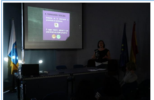
Imagen 3. Presentación explicativa del PPC

Tras esta explicación, se procede, a través de otra presentación, a explicar la actualidad y los objetivos del Plan General de Ordenación de Santa Cruz. Se exponen, finalmente “Las reglas del Juego”, es decir, el cometido del Programa de Participación Ciudadana en relación a la posible inclusión de las propuestas que emanen de él en el PGO y las limitaciones que este impone. También se hace alusión al Plan Rector de Uso y Gestión del Parque Rural de Anaga (PRUG) y la necesidad de renovarlo.