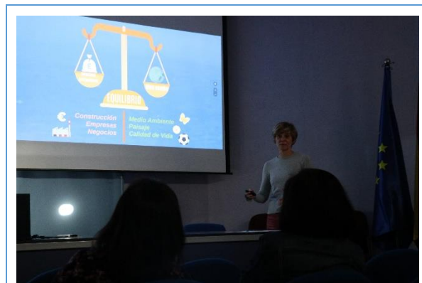
Imagen 4. Explicación del PGO y “Las reglas del juego”

Tras esta explicación, se procede, a través de otra presentación, a explicar la actualidad y los objetivos del Plan General de Ordenación de Santa Cruz. Se exponen, finalmente “Las reglas del Juego”, es decir, el cometido del Programa de Participación Ciudadana en relación a la posible inclusión de las propuestas que emanen de él en el PGO y las limitaciones que este impone. También se hace alusión al Plan Rector de Uso y Gestión del Parque Rural de Anaga (PRUG) y la necesidad de renovarlo.