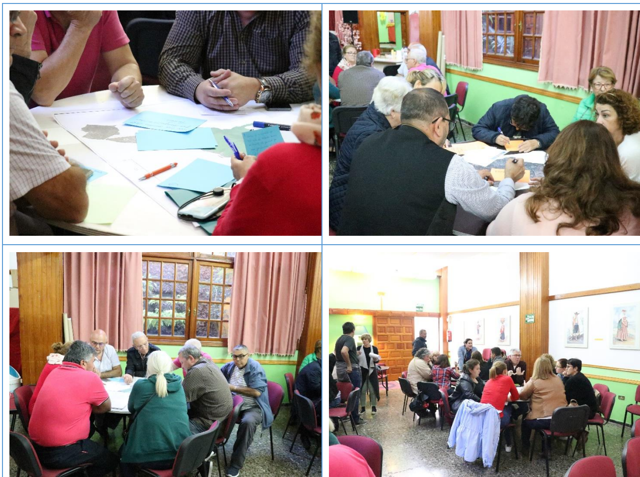
Imágenes 3,4,5 y 6: trabajo en las mesas

Tras realizar la exposición anteriormente comentada y, siguiendo el programa establecido para la jornada, se procede a iniciar el trabajo grupal. Los participantes se dividen, de forma aleatoria, en seis grupos de trabajo. Aunque se explicó la metodología diseñada para el taller y se distribuyó entre las diferentes mesas el cometido de su trabajo, consistente en la realización de un diagnóstico (aspectos positivos y a mejorar), tanto del Distrito como del municipio, los participantes decidieron trabajar, de forma mayoritaria, el ámbito del Distrito. Tan solo en una de las mesas se trabajaron algunos aspectos relativos al conjunto del término municipal.