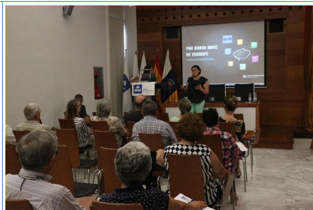
Imagen 3. Presentación del PPC

Tras esta explicación, se procede a exponer la situación de partida y los objetivos que se plantea el Plan General de Ordenación de Santa Cruz de Tenerife. Se exponen, finalmente, “Las reglas del Juego”, es decir, el cometido real del Programa de Participación Ciudadana en relación a la posible inclusión de las propuestas que emanen de él en el PGO, y las limitaciones que este instrumento de planificación impone. Aunque ya se ha comentado anteriormente, se vuelve a hacer hincapié en que las propuestas que surjan en el transcurso de los talleres, serán estudiadas con el fin de valorar la viabilidad de su incorporación al PGO. Se expone que, en el caso de aquellas propuestas que no puedan ser incorporadas en la redacción del PGO, el equipo redactor explicará los motivos de su “ no inclusión ”, en el taller de Exposición Pública que se realizará al finalizar el PPC. A continuación, se inicia un turno de ruegos y preguntas, en el que las personas participantes realizan intervenciones en las que manifiestan sus dudas acerca del desarrollo del programa de participación, así como del PGO, las cuales son aclaradas por el equipo de participación ciudadana.