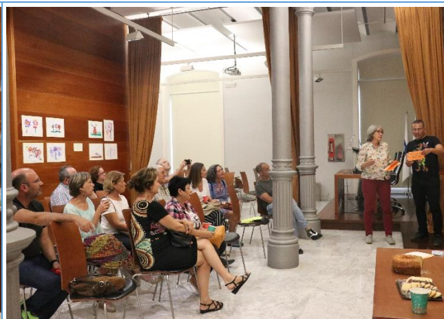
Imagen 7. Plenario mesa del Municipio