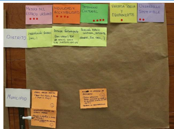
Imagen 9. Resultados del panel de aspectos a mejorar