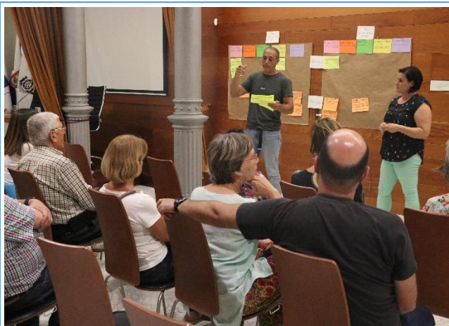
Imagen 6. Plenario mesa del Distrito